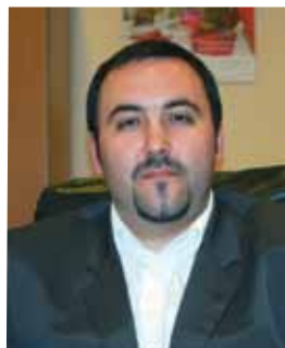
Членови на УО на GS1 Македонија

Среќни сме што успеавме да нашите корисници од стопанскиот и нестопанскиот сектор денес ја препознаваат GS1 Македонија како респектабилен деловен партнер, кој со својот широк спектар на услуги и бесплатна стручна помош им овозможува да ја зголемат ефикасноста, безбедноста и профитабилноста преку прифаќање и користење на стандардите. Од трговија на мало до здравство, од прехранбена индустрија до транспорт и логистика, GS1 стандардите постојано го трансформираат и подобруваат бизнисот и животот на сите нас во Република Македонија.