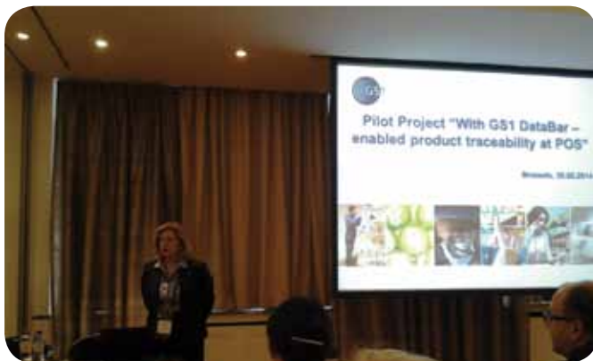
GS1 Global Forum 2014, Брисел

Нашиот успешен Проект привлече глобално внимание што резултираше со негова меѓународна промоција на GS1 Глобалниот форум во Брисел во февруари 2014 година и објава во GS1 in Touch - електронско издание на Меѓународната организација за исклучителни достигнувања на националните организации.