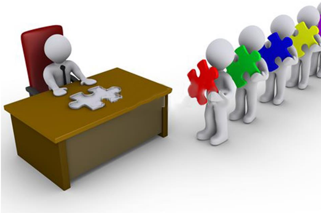
Традиционален начин на нарачка