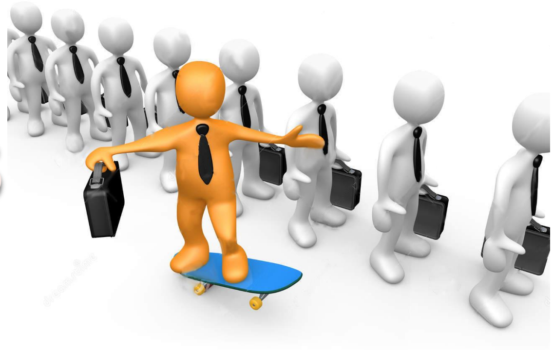
EDI начин на нарачка