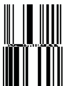
GS1 DataBar Stacked Omnidirectional

Свежи производи, мали потрошувачки пакувања (само GTIN)