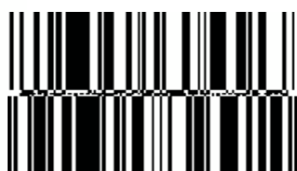
GS1 DataBar Expanded Stacked

Производи со променливи мерки (GTIN+дополнителни податоци)